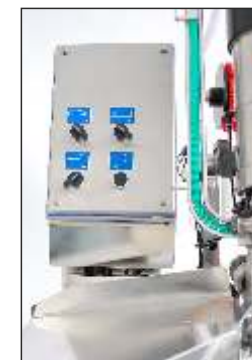
Füllmaschinensteuerung Stuffer control