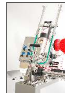
Einfaches Handling - Schnelle Reinigung Easy handling - fast cleaning