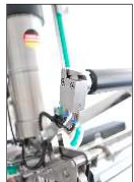
Messer- und Schlaufenauslösung in VA Knife and loop release made in stainless steel