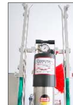
Das Wichtigste stets im Blick The main thing in your sight